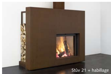
Stûv 21 + habillage